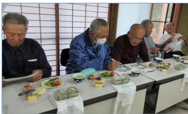
ゲートボールと同日開催だから 男性参加者多し！