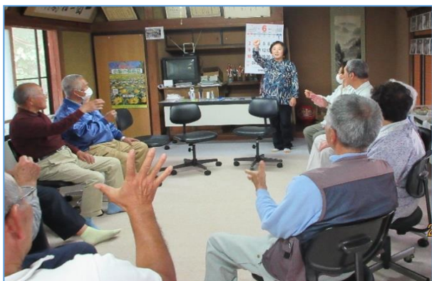
健康福祉推進員さんと 一緒にレクリエーションタイム