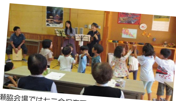
瀬協会場では七二会保育園のお友だちも飛び入り参加。だいち先生はカホン（打楽器）、子どもたちはダンス！！音楽って、たのしいね♪